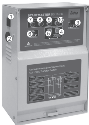
Startmaster BS 11500